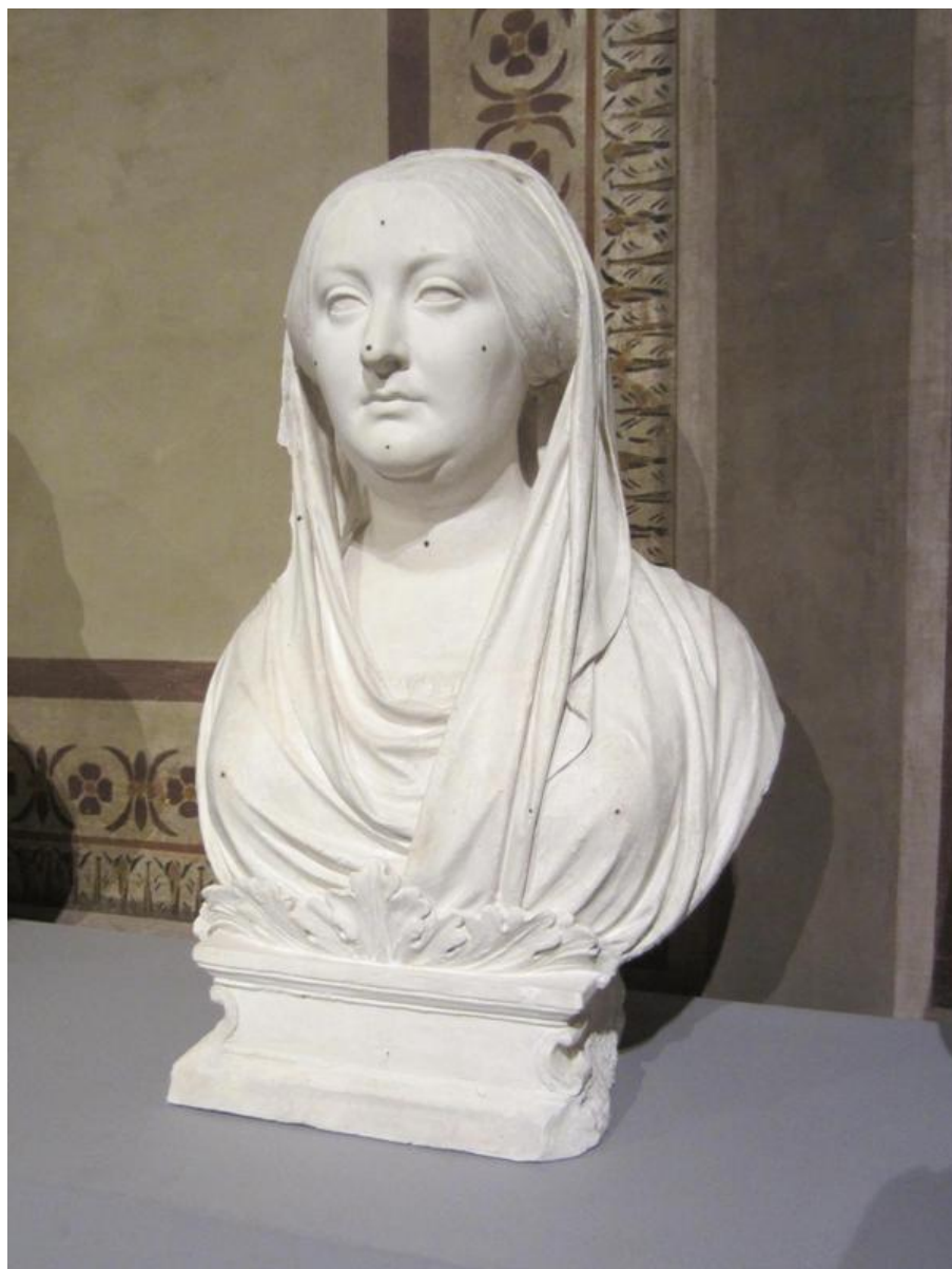
Zinaida Wolkońska (1791-1862)