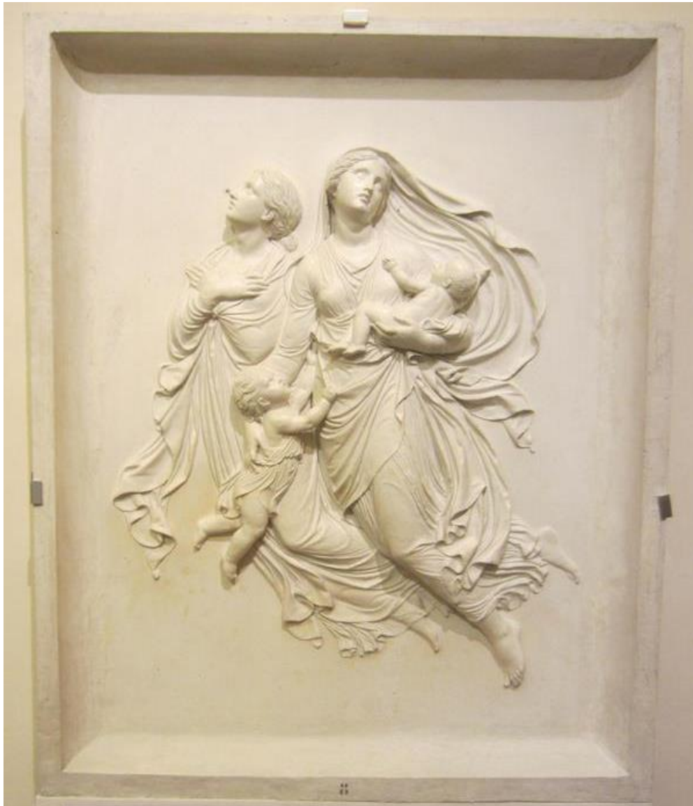
Dusze wlatujące ku Niebu (1825)

Przy płaskorzeźbie zamieszczono następującą informację: