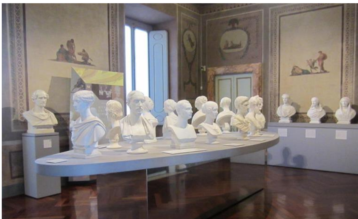
Museo di Roma – Sala „Ritratto di una società cosmopolita” – przy ścianie marmurowy autoportret Pietra Teneraniego

Położone w centrum Wiecznego Miasta Museo di Roma jest kustoszem wielu polskich pamiątek. O niektórych pisałam już, np. w artykule „Polski akcent w Museo di Roma”. Tym razem pragnę zwrócić uwagę na kilka rzeźbiarskich poloników, których twórcą był znany włoski artysta Pietro Tenerani (1789-1869) . Spod jego dłuta wyszły m.in. marmurowe popiersia Zofii Branickiej Odescalchi, Bolesława Potockiego i Zygmunta Krasińskiego (szwagra Zofii Branickiej) – gipsowe modele tych prac są częścią stałej ekspozycji Muzeum, kto wie, ile innych kryją muzealne magazyny... Posiadacze MIC CARD mogą zobaczyć stałą ekspozycję bezpłatnie.