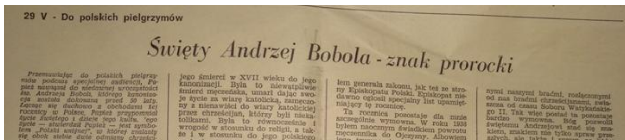
L'Osservatore Romano (wyd. polskie) nr 5 (1988), s. 8.