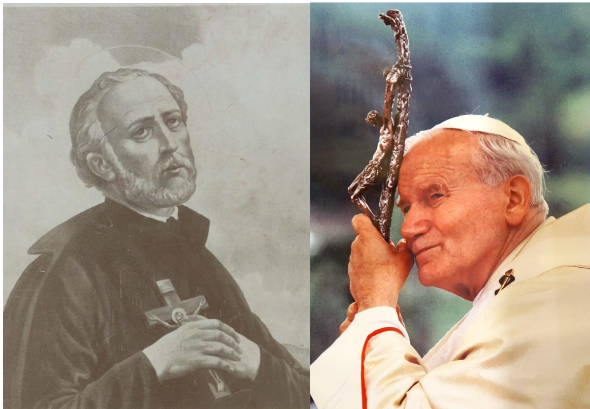
Fragm. okładki broszury „Św. Andrzej Bobola. Pamiętnik kanonizacji i powrotu”, Jan Paweł II

W dniu 16 maja przypada wspomnienie św. Andrzeja Boboli SJ (1591-1657) - polskiego jezuitę-męczennika, którego pieczy powierza się ład ekumeniczny i niepodległościowy oraz dobre stosunki z narodami zza wschodniej granicy Polski. Jego wstawiennictwa wzywa się również w czasach epidemii. W 2002 roku, za pontyfikatu Jana Pawła II, Św. Andrzej Bobola SJ został formalnie ogłoszony patronem Polski. W Rzymie, relikwie św. Andrzeja Boboli znajdują się m.in. w kościele il Gesù . Wystawione są na stałe w kaplicy Trójcy Świętej - Cappella della Santissima Trinità.