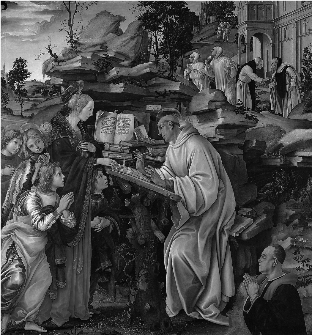
il. 2 F. Lippi, Wizja św. Bernarda, ol., deska, 1478