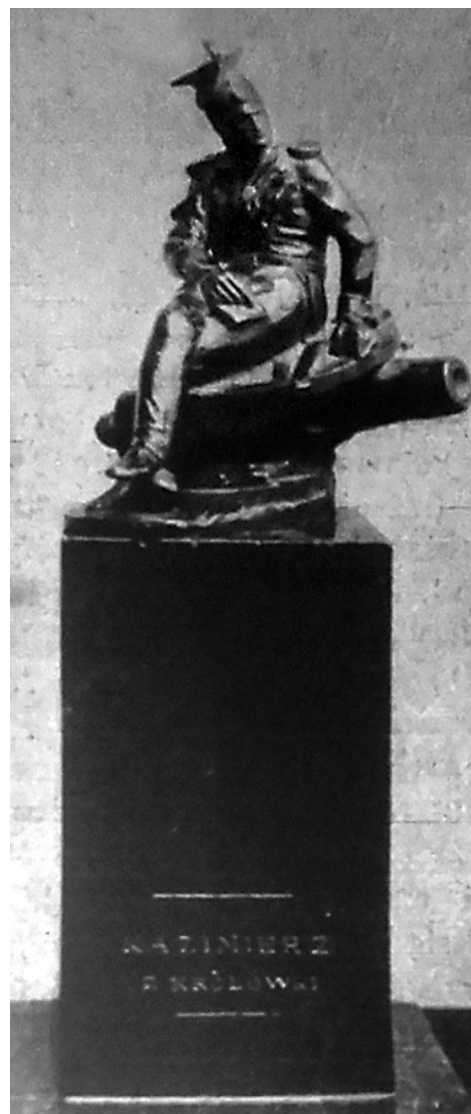
il. 8 T. Lenartowicz, figurka z przedstawieniem K. Brodzińskiego, „Tygodnik Ilustrowany” 1917, nr 7, s. 97