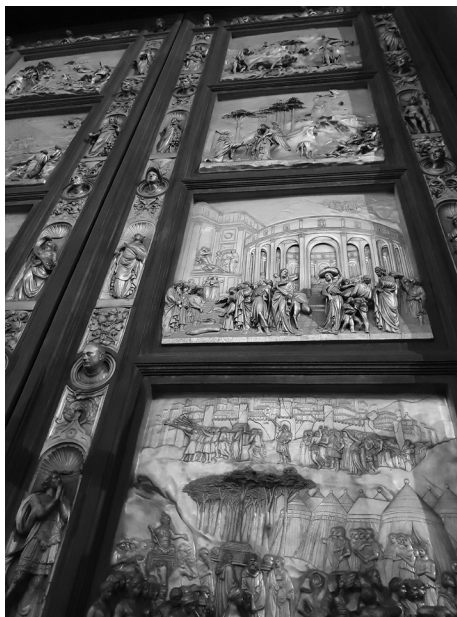
il. 5 L. Ghiberti, Detale wschodnich drzwi bazyliki San Giovanni we Florencji , 1425–1450, brąz.