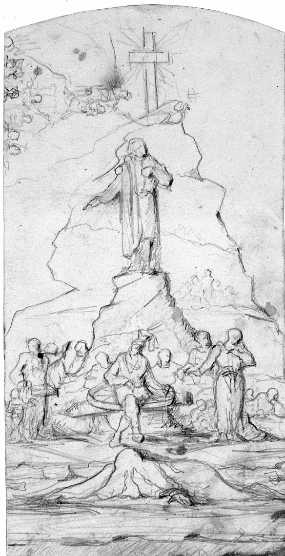
il. 3 T. Lenartowicz, szkic do rzeźby Parnas polski (pomnik Mickiewicza), oł., papier; Biblioteka Jagiellońska, nr inw. JR. 1541 t. 22.

Stopniowo, z postępem nauki, rysunki zaczęły artyście służyć za schemat czy wzór przyszłej rzeźby, choć Lenartowicz nie zawsze wykonywał szkice do swoich dzieł, o czym sam wzmiankował: