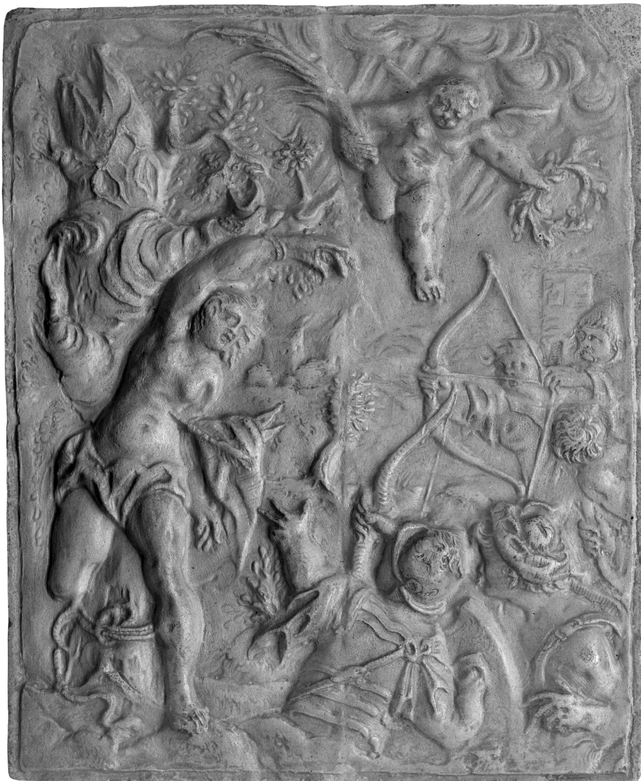
il. 4 T. Lenartowicz, Męczeństwo św. Sebastiana , gips, odlew, ok. 1868; Muzeum Narodowe w Krakowie, nr inw. II-rz-1335.